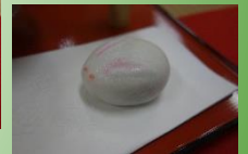
お客様に点茶をしていただきました