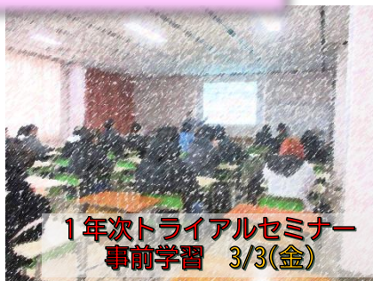
1 年次トライアルセミナー 事前学習 3/3(金)