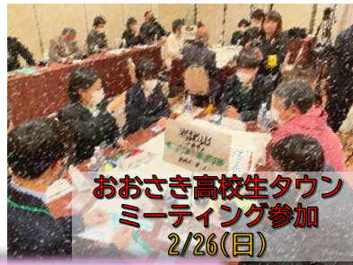
おおさき高校生タウン ミーティング参加 2/26(日)