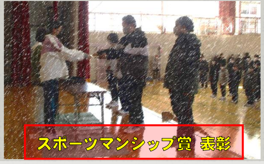
スポーツマンシップ賞 表彰

昨年は秋に実施していた球技大会を、今年度は大きく時期を変更し、2月21日(火)に実施しました。開催に当たっては、実行委員生徒の話し合いにより、以下のように運営することになりました。