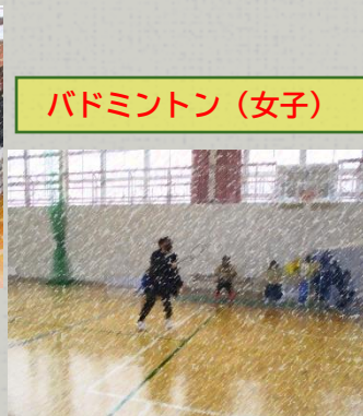
バドミントン(女子)