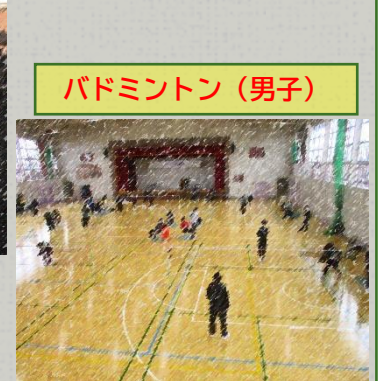
バドミントン(男子)