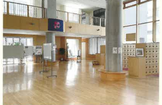
さくらギャラリー